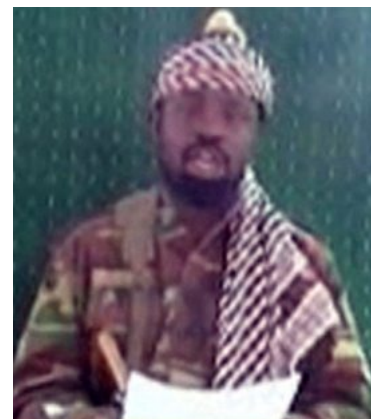
Abubakar Shekau, de schimmige aanvoerder van de terreurorganisatie Boko Haram.

Van Boko Haram-leider Shekau is weinig bekend. Niemand weet hoe oud hij is of waar hij zich ophoudt. In een zeldzame videoboodschap zegt Abubakar Shekau, die het midden lijkt te houden tussen moslimintellectueel en gangster, dat hij 'geniet van elke moord die God me opdraagt'. Onder zijn leiding vergrootte