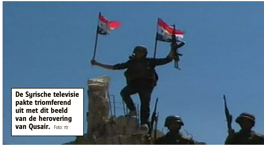
De Syrische televisie pakte triomferend uit met dit beeld van de herovering van Qusair.