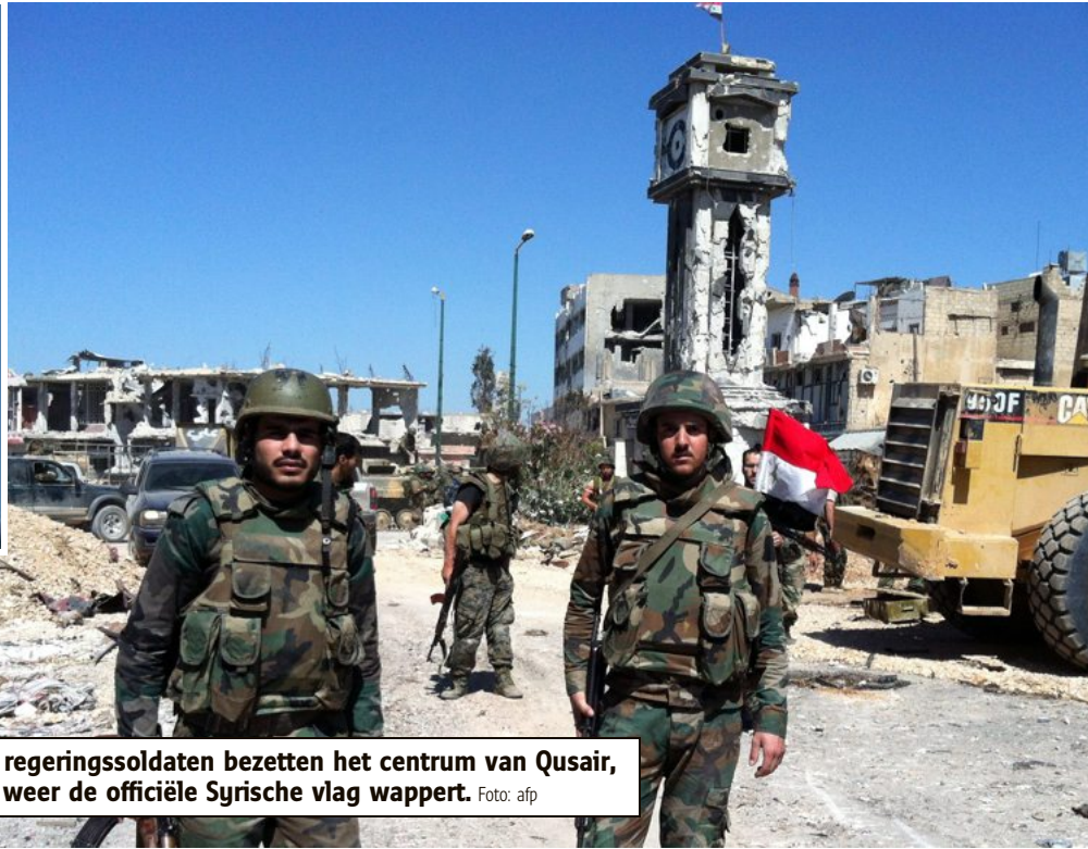
Syrische regerings soldaten bezetten het centrum van Qusair, waar nu weer de officiële Syrische vlag wappert.