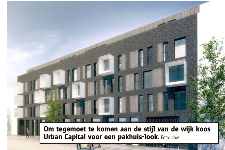
Om tegemoet te komen aan de stijl van de wijk koos Urban Capital voor een pakhuis-look.

jaar een wedstrijd van de stad, waarbij de projectontwikkelaar enkele duidelijke